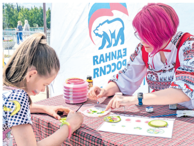
Мастер-класс по росписи