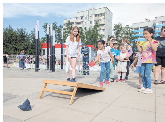
Игры для детей