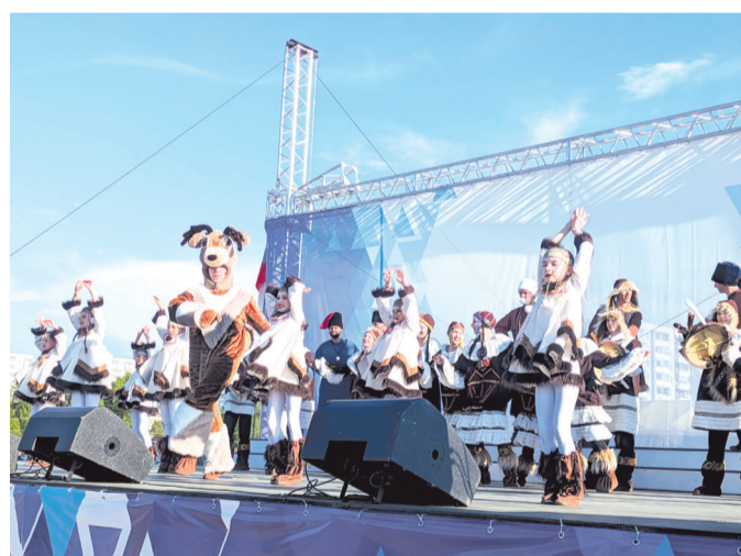
«Сказание о земле Илимской»