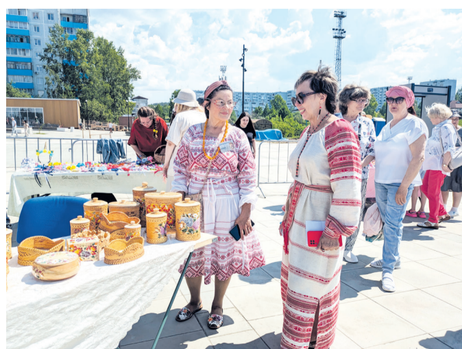
Изделия из бересты