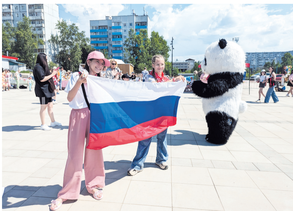
Главный атрибут праздника

Старт празднику дал второй городской фестиваль творчества и ремесла «Город мастеров». Первые его провели год назад и приурочили к 50-летию Усть-Илимска. Он сразу полюбился горожанам, и организаторы – комитет культуры администрации Усть-Илимска – решили сделать его ежегодным. В этом году в нем участвовало более 70 мастеров из Усть-Илимска и Усть-Илимского района, из Братска. Братчане, например, привезли авторские экопродукты. А вообще на фестивале были представлены десятки уникальных изделий ручной работы в совершенно различных техниках. Это вязаные игрушки, изделия из дерева и кожи, металла, бересты, шерсти, украшения, предметы для декора и быта, расписные