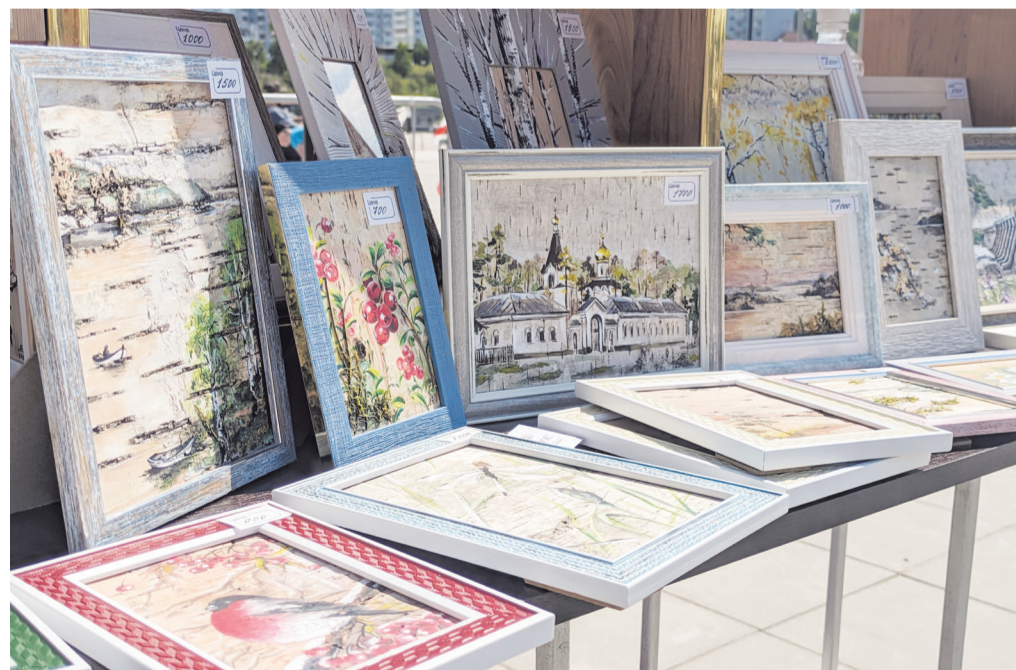
Картины усть-илимских художников