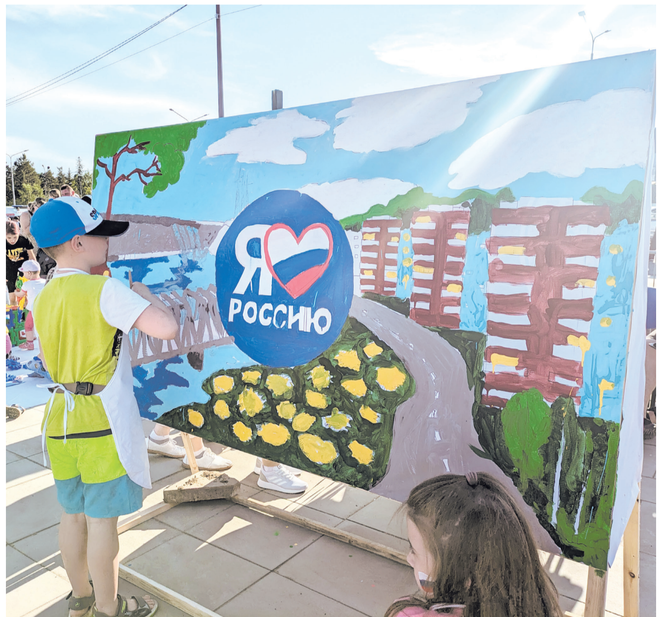
Большую раскраску с главными символами Усть-Илимска и страны подготовили для горожан художники ДК «Дружба»

12 ИЮНЯ УСТЬИЛИМЦЫ ОТМЕТИЛИ ДЕНЬ ГОРОДА И ДЕНЬ РОССИИ