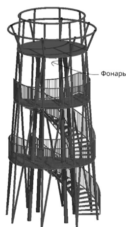
Смотровая вышка с прообразом маяка