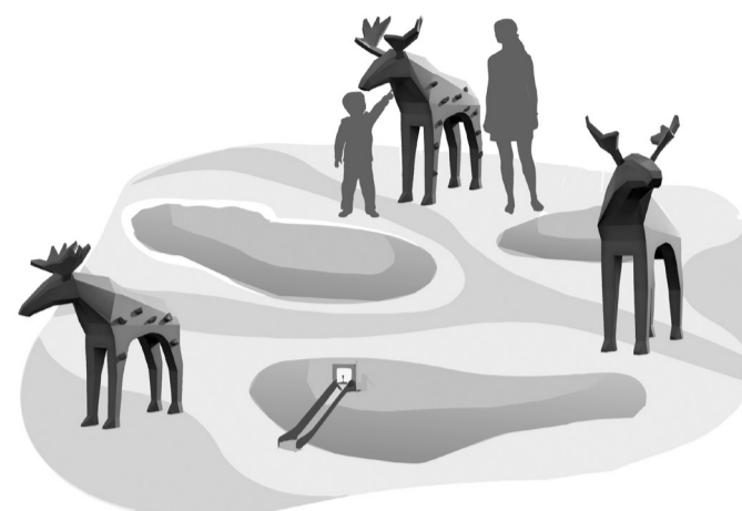
Главная тема проекта отразится в планировочной структуре детской площадки. В геопластике здесь будут созданы три острова и разместятся скульптуры трех лосят