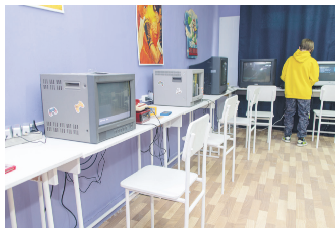
Все экспонаты игрового музея рабочие и доступны посетителям

Олег покупает, что-то нашли на своих антресолях и подарили друзья.