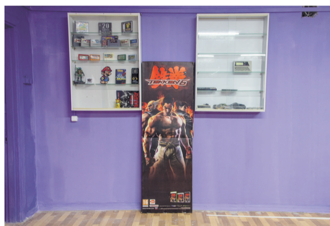
Стеклянная витрина для хранения мелких «ретроштучек»

Спрашиваю, как же удалось добыть столько «сокровищ»? Большинство