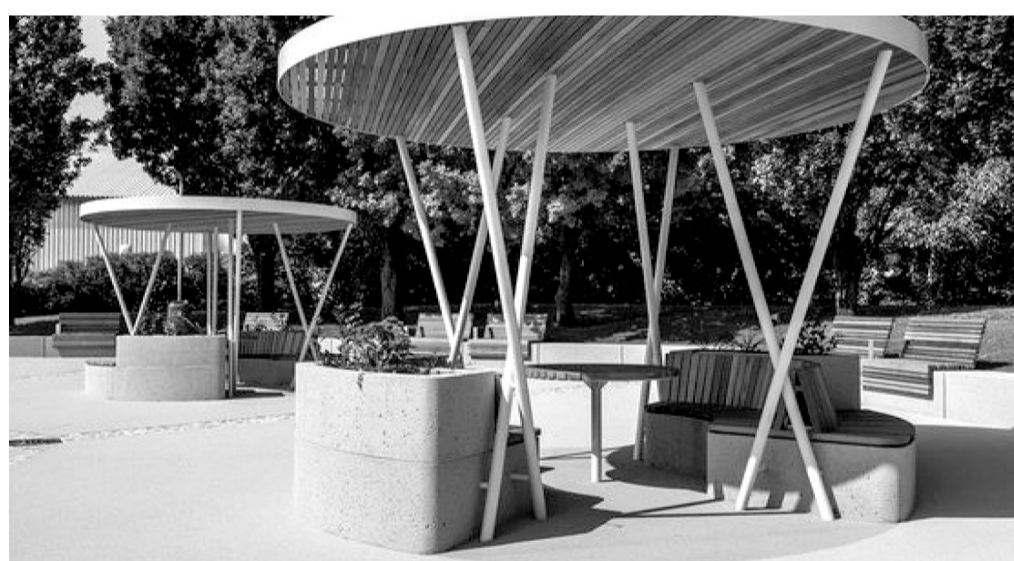
Вариант зоны пикников