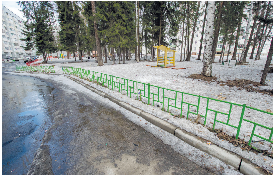
Чтобы машины не ставили между трех сосен, жители дома № 15 по ул. Карла Маркса установили ограждения

В 2023 ГОДУ АДМИНИСТРАТИВНАЯ КОМИССИЯ УСТЬ-ИЛИМСКА ПРОВЕЛА 48 ЗАСЕДАНИЙ, НА КОТОРЫХ РАССМОТРЕЛА 752 ДЕЛА ОБ АДМИНИСТРАТИВНЫХ ПРАВОНАРУШЕНИЯХ