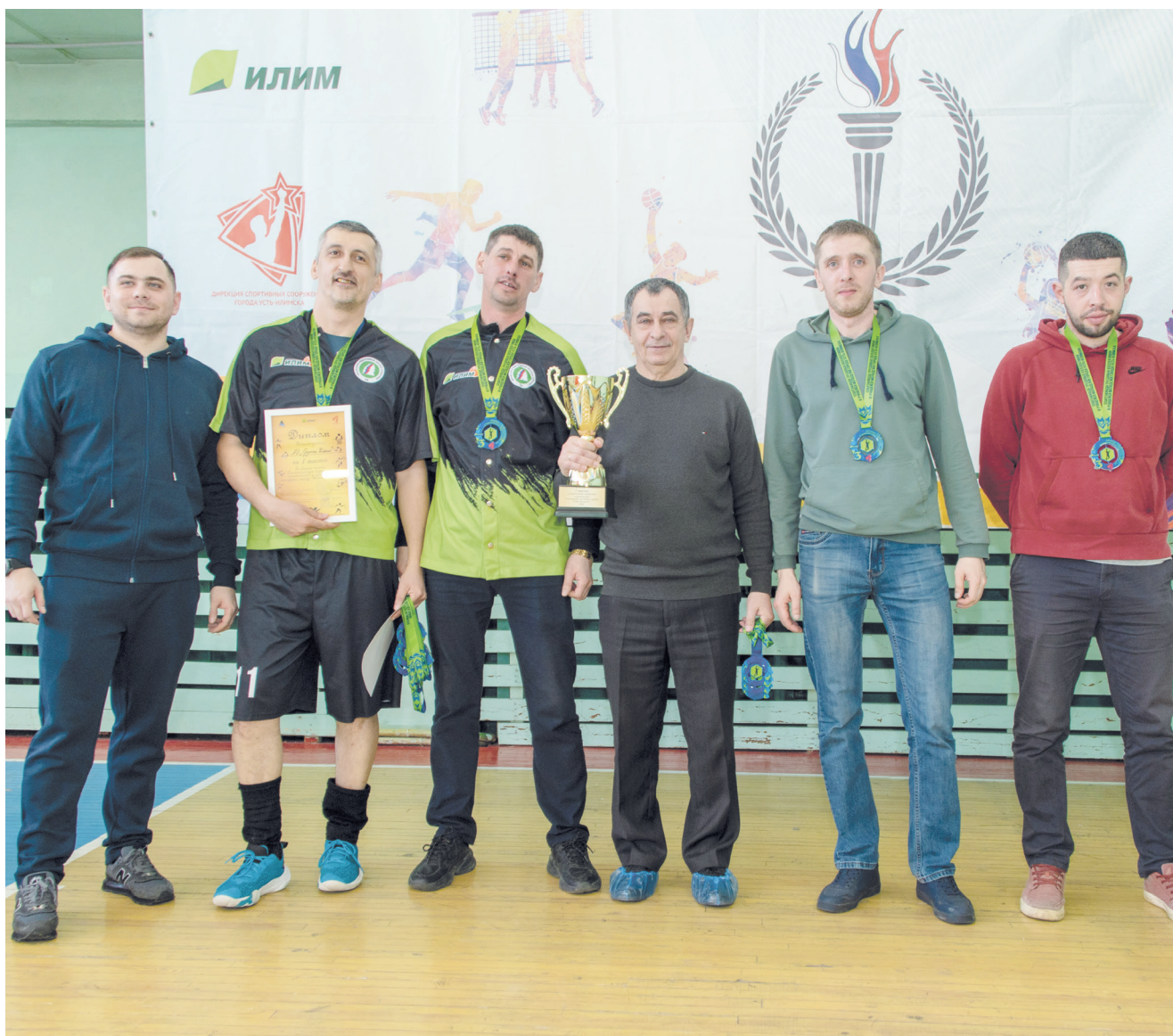
Кубок спартакиады – у команды «Илим»

ЗАВЕРШИЛАСЬ СПАРТАКИАДА ТРУДОВЫХ КОЛЛЕКТИВОВ И УЧАЩЕЙСЯ МОЛОДЕЖИ УСТЬ-ИЛИМСКА. В МИНУВШЕЕ ВОСКРЕСЕНЬЕ В ДОМЕ СПОРТА «ЮНОСТЬ» ПОДВЕЛИ ИТОГИ МАСШТАБНОГО СПОРТИВНОГО СОБЫТИЯ И НАГРАДИЛИ ПОБЕДИТЕЛЕЙ