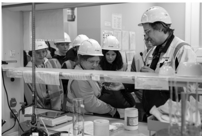
В лаборатории ЦКК