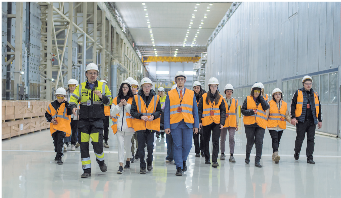
Старшеклассники Усть-Илимского района - участники «Энергии лидерства» посетили с экскурсией целлюлозно-картонный комбинат

27 АПРЕЛЯ В ДК «ДРУЖБА» СОСТОЯЛАСЬ ТОРЖЕСТВЕННАЯ ЦЕРЕМОНИЯ НАГРАЖДЕНИЯ ПОБЕДИТЕЛЕЙ И ПРИЗЕРОВ КОНКУРСА НА ПРИСУЖДЕНИЕ СТИПЕНДИИ ГРУППЫ «ИЛИМ» «ЭНЕРГИЯ ЛИДЕРСТВА»