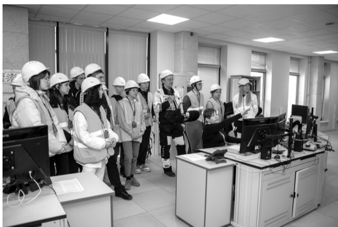
На центральном пульте