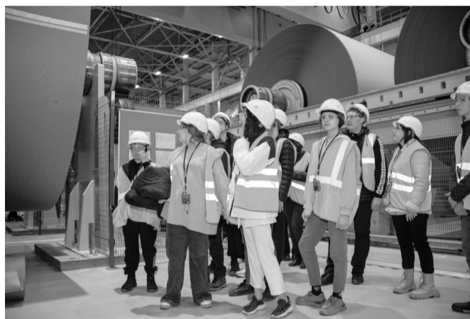
Вот такой он, усть-илимский картон

За каждым победителем и участником конкурса стоят его наставники. Спасибо педагогам, которые помогают учениками пройти непростой конкурсный путь и стать победителями. Для ребят, которые растут, развиваются и задаются серьезными вопросами, роль наставника бесценна.