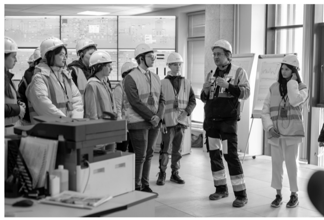
В центральной диспетчерской