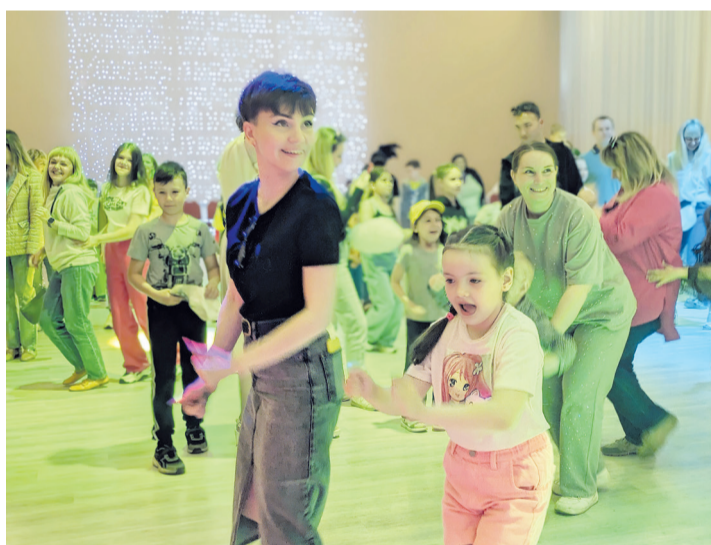
Совместные игры и танцы