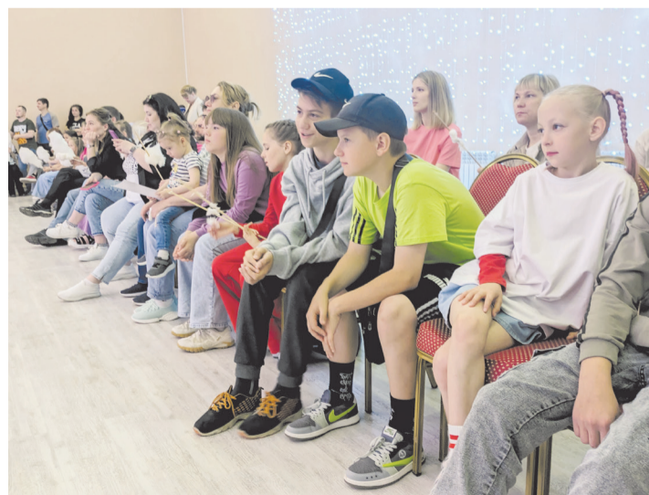
Во время награждения