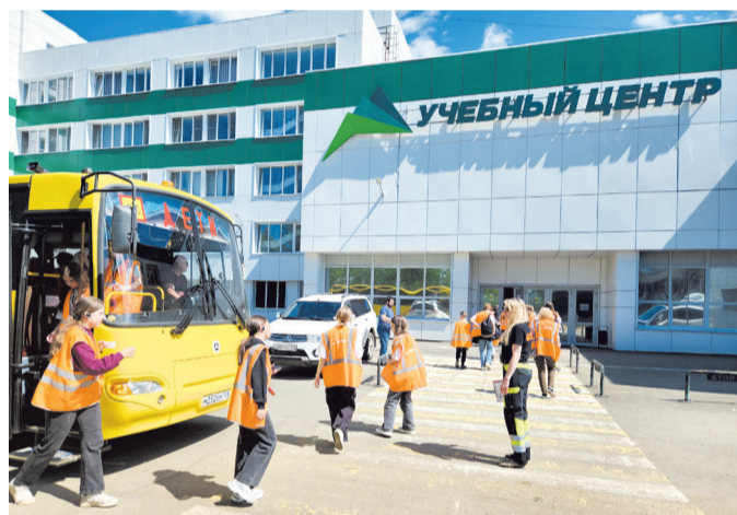
Учебный центр Группы «Илим»