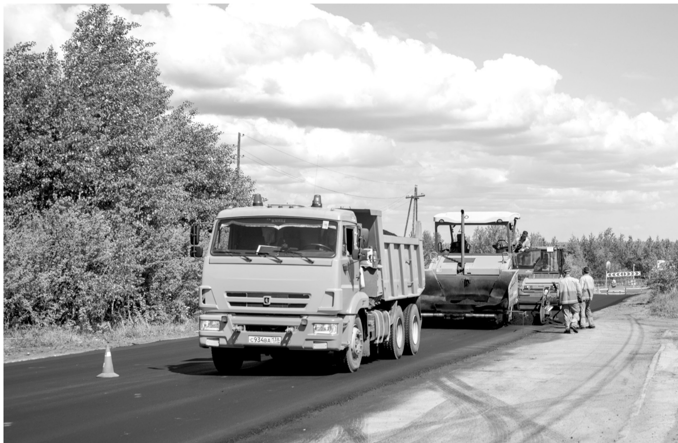
22 мая специалисты производства по строительству мостов и ремонту дорожной инфраструктуры филиала в Усть-Илимском районе отремонтировали участок трассы ЛПК – Старый город

Также традиционно этим летом в рамках соглашений