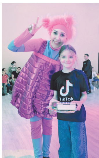
Вручение дипломов и призов