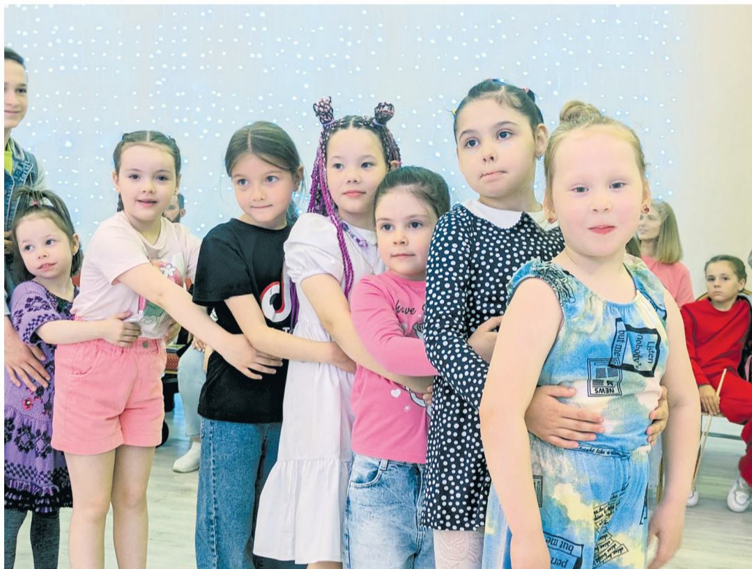
Участники конкурса во время игр