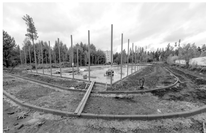
Спортивная площадка в 10-м микрорайоне