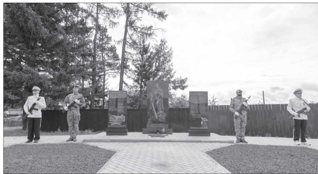
Дань памяти и уважения воинам отдает молодое поколение