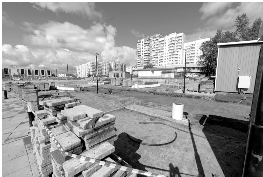
Площадь напротив ДК «Дружба»