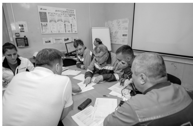
Комиссия подсчитывает баллы

- Вы, ребята, пока еще не старшие рабочие, не звеньевые, документальное оформление некоторых процессов, то же заполнение наряд-допусков, еще не выполняли. Поэтому в этой части задания была одинаковая для всех ошибка – именно по оформлению. В целом же итогами конкурса