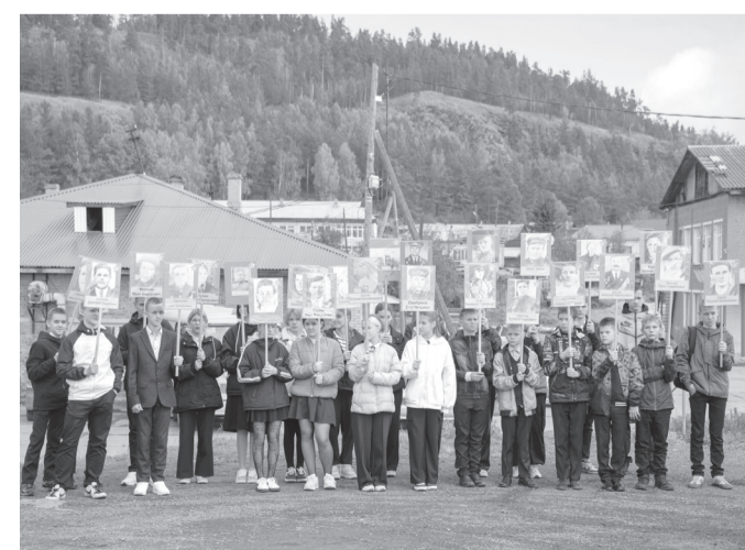
«Бессмертный полк» представляют учащиеся школы № 1 Усть-Илимска