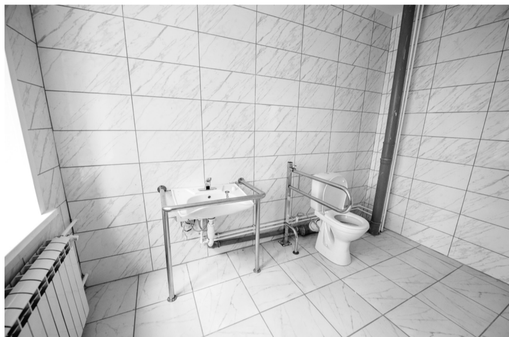
Место, где после проведения малых хирургических процедур пациент может привести себя в порядок