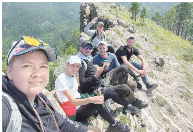
Команда «Солянка». Поднялись на гору Майлгар