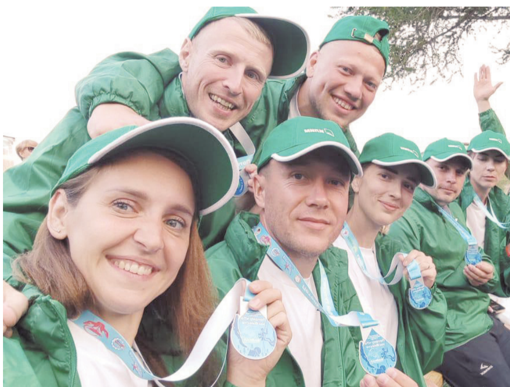
Команда «Хвоя» с медалями турслета

Также были туристическая полоса препятствий, водная дистанция, спортивное ориентирование, конкурс бивуаков и творческий конкурс.