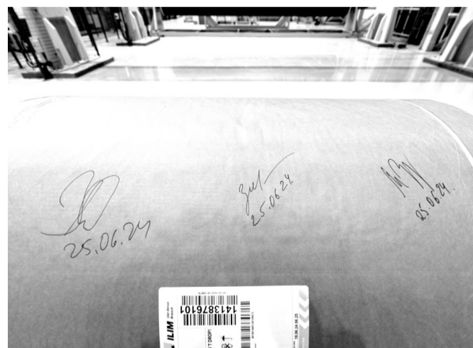
Здесь расписались члены Совета директоров

процессами сохраняется потребность в централизации систем управления производства целлюлозы и