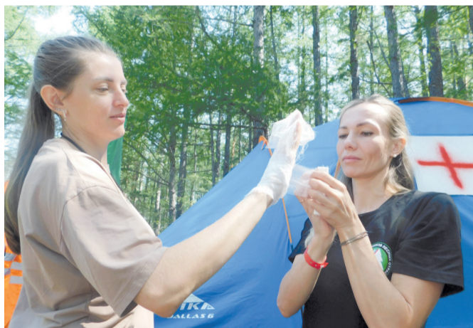
Команда «Солянка». Оказание медицинской помощи