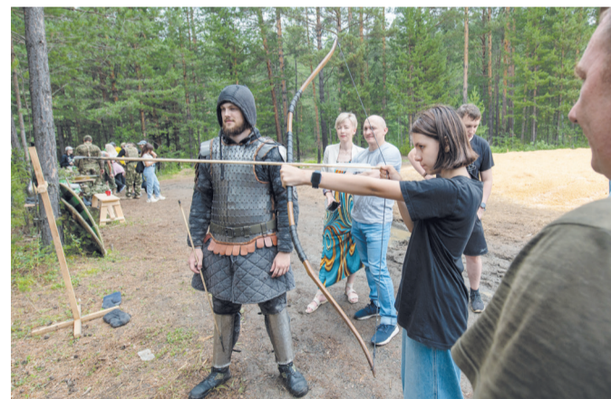
Стрельба из лука: проба можно было неограниченное количество раз