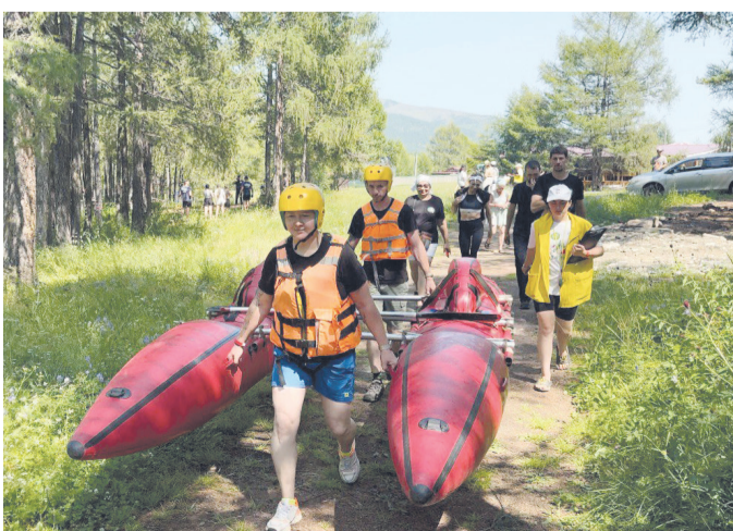
Команда «Солянка». Катамаран нужно было нести от старта на воду, а потом с воды на финиш