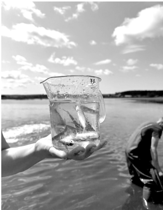
Через три года нынешние мальки достигнут веса в три килограмма