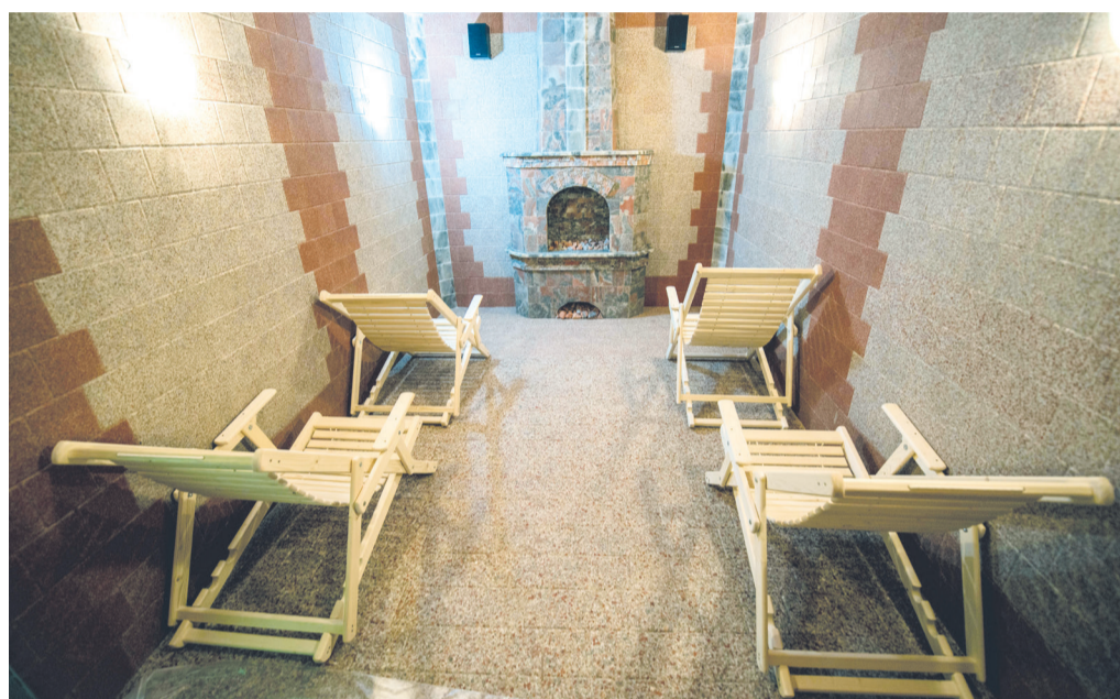
В будущем отделении реабилитации уже смонтирована соляная шахта

- На уровне федерации реализуется программа по