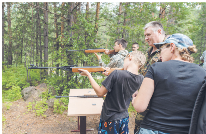
Стрельба из пневматической винтовки

20 июля на поляне возле реки Карапчанка прошел традиционный казачий фестиваль «Сибирь моя – казачий край»