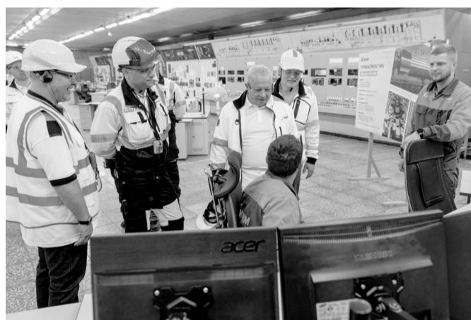
Пульт ТЭС. Управление турбинным отделением