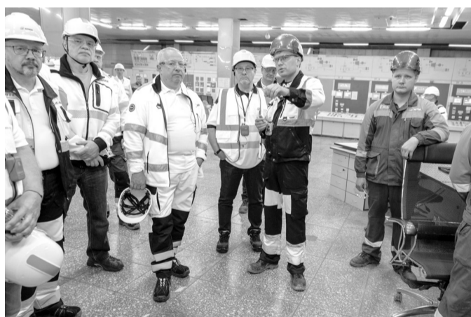
Пульт ТЭС. Управление котельным отделением