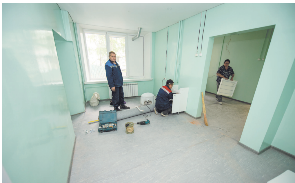
Ремонтные работы в завершающей стадии