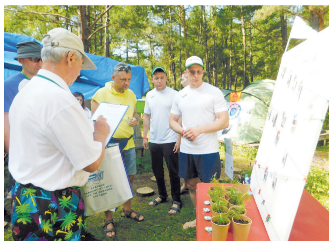
Команда «Хвоя» представляет свой бивуак

Оксана Квинт