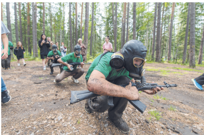
Полоса препятствий была непростой