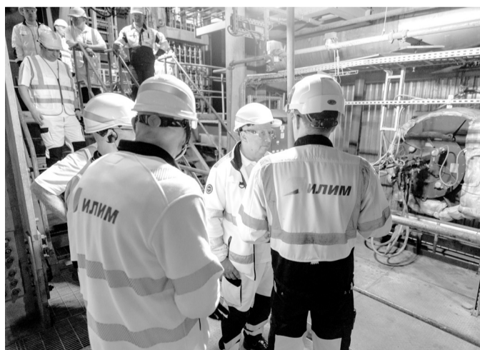
Корьюевой котел № 4