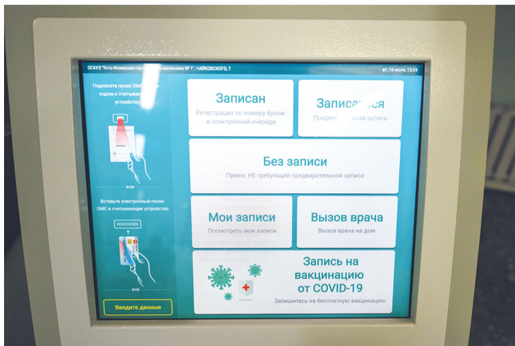
Терминал для записи к врачу