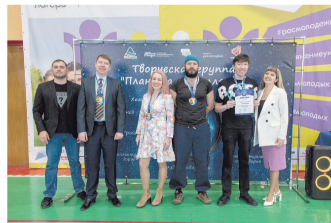
Команда взрослых «Мы пришли за бегемотом»