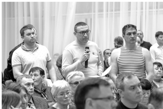
С вопросом о земле на встречу с губернатором пришли владельцы участков в 15-м микрорайоне города

Когда к микрофону подошла группа представителей многодетных семей, которым в 2017 году администрация города выделила 170 земельных участков в 15-м микрорайоне, стало понятно, что встреча окончательного свернула с пути своего изначального сценария и что остальные министры не успеют выступить со своими докладами. С 15-м микрорайоном тоже долго разбирались. Сначала губернатор и министры выясняли, где этот микрорайон находится в принципе. Очень удивились, что в центре города, что со всех сторон он окружен разного рода коммуникациями – тепло- и водоснабжения, канализацией, но кроме электричества в микрорайоне нет ничего. Нет и дорог, хотя по закону всеми этими благами цивилизации территории, выделяемые для льготных категорий граждан, должны быть обеспечены изначально.