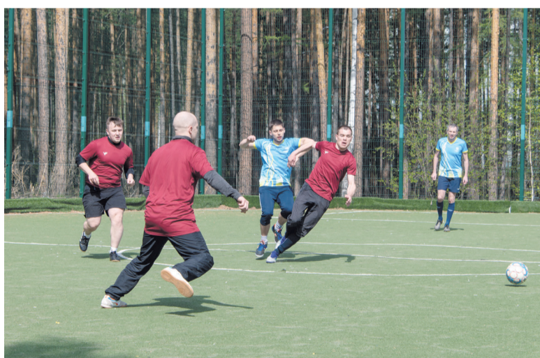
Встречаются команды «Сила безопасности» и «Солянка», счет игры 2:0 в пользу «Солянки»

25 мая состоятся полуфиналы и финалы. В первом полуфинале