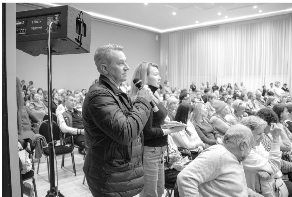
Были свои вопросы и у представителей дачных кооперативов