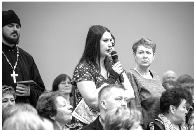
Жители п. Железнодорожный спрашивают про дороги

Прошло семь лет, но воз и ныне там. Более того, время упущено, и, как сообщил по конференц-связи министр строительства Иркутской области, единственное, что остается – строить дороги, прокладывать сети в рамках обязанностей муниципалитета. Деньги – вероятные, помнится, еще в 2017 году звучала сумма в 300 млрд рублей.