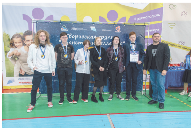
Команда «Ленинские высоты», школа № 8