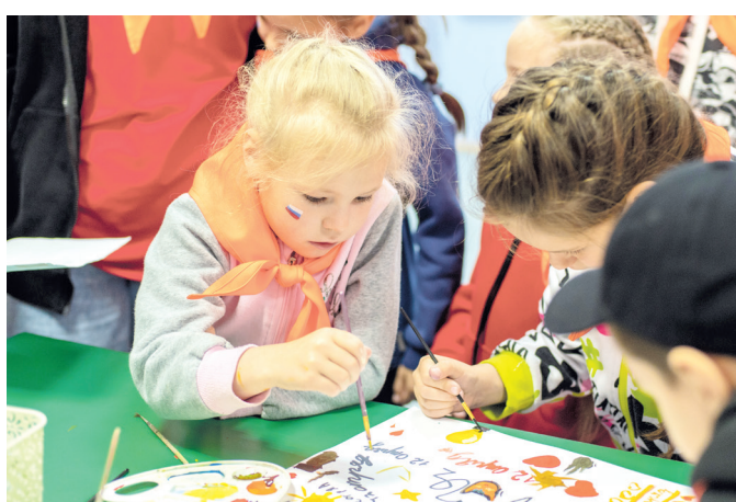
На станции «Создавай и вдохновляй» надо было правильно перерисовать иероглиф. Ребята из самого младшего отряда № 12 подошли творчески, не только нарисовали, но и разукрасили свой рисунок