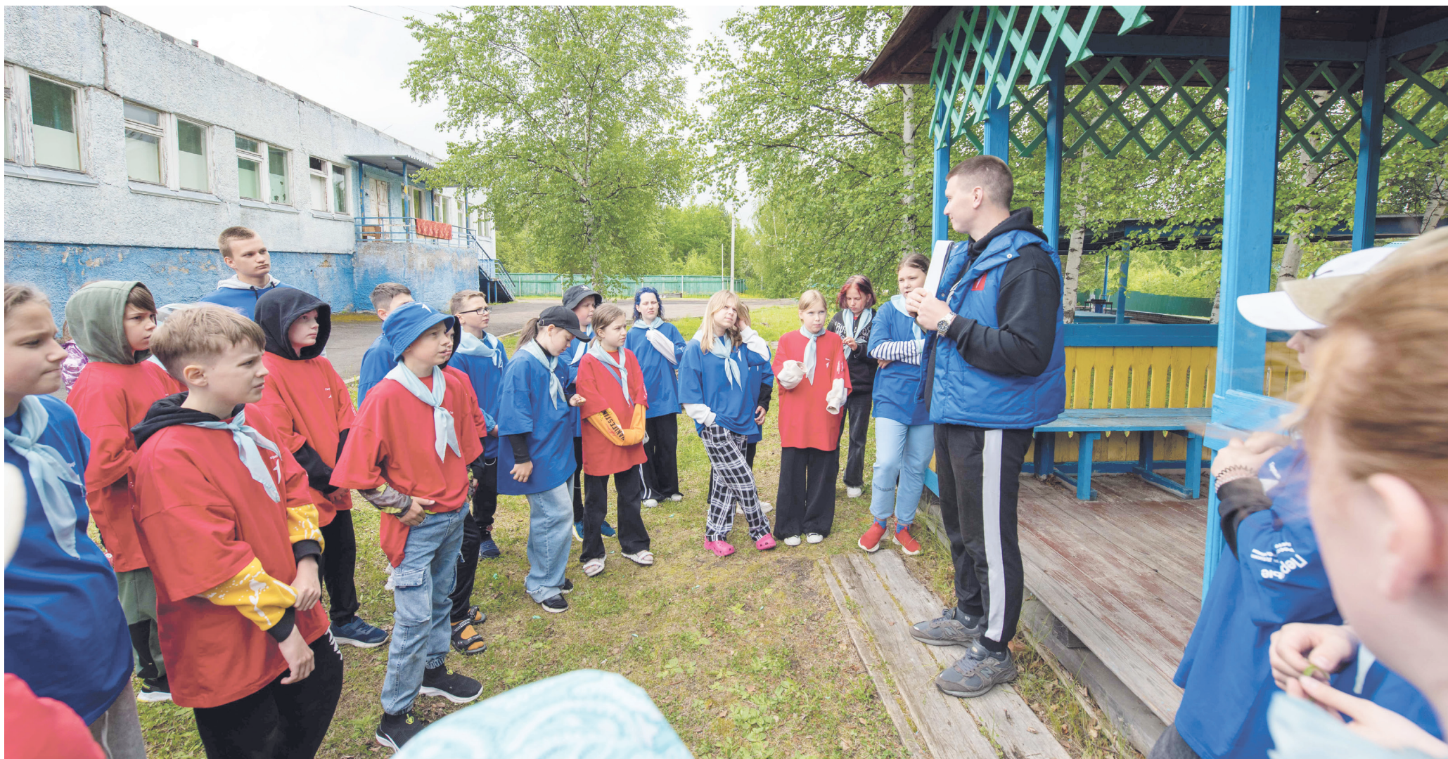
На станции «Будь здоров» в формате игры «правда или миф» вспоминали о вредных и полезных привычках питания и о здоровом образе жизни