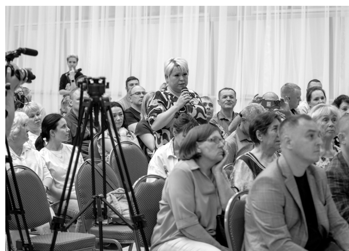
Жители улицы Братской спросили, когда залатают ямы на их улице