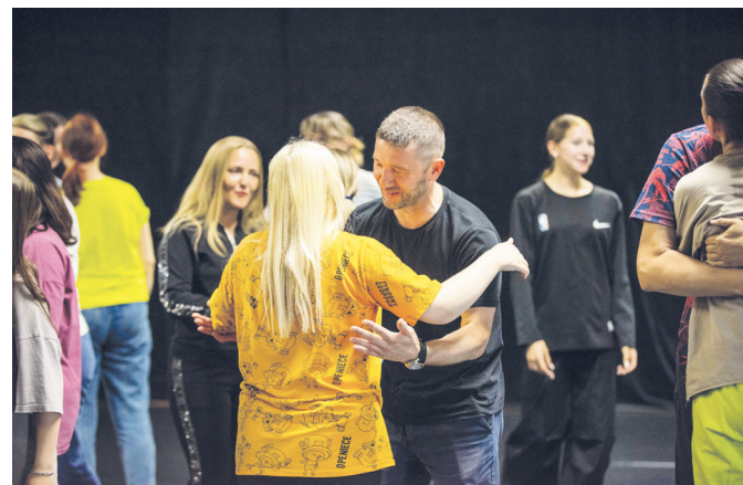
Здороваемся разными способами