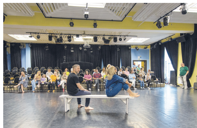
Обиделись друг на друга. Будем мириться