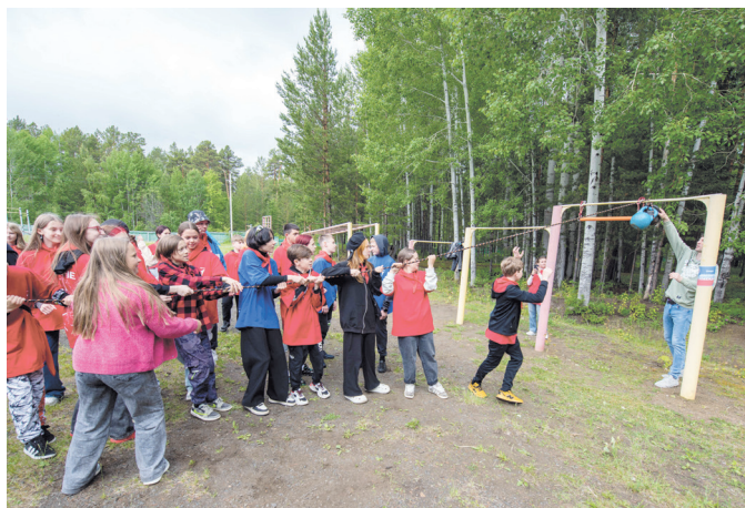
На станции «Достигай и побеждай» надо было всем отрядом поднять гири (общий вес 32 кг), подтянуться на турнике, чеканить мяч не менее пяти раз, пройти задание на поддержку другу друга в команде