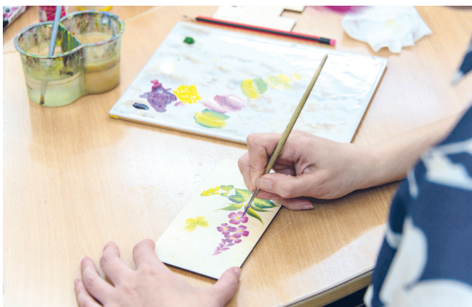
Иван-чай от Натальи Зинченко