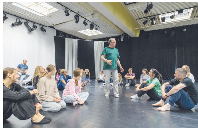
Внимает слову мастера