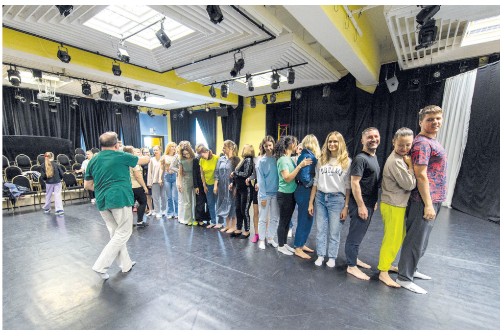
Выстраиваемся по росту

20 ИЮНЯ РЕЖИССЕР И ПРЕПОДАВАТЕЛЬ АКТЕРСКОГО МАСТЕРСТВА ВЛАДИМИР КОРЯКИН ИЗ ПЕРМИ ПРОВЕЛ ДЛЯ ЗРИТЕЛЕЙ УСТЬ-ИЛИМСКОГО ТЕАТРА ДРАМЫ И КОМЕДИИ МАСТЕР-КЛАСС. ПОУЧАСТВОВАЛИ В НЕМ И КОРРЕСПОНДЕНТЫ «ВЕСТНИКА»