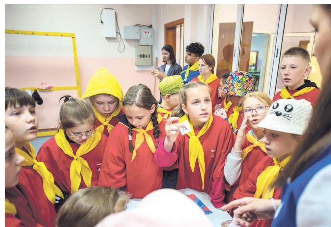
На станции «Найди призвание» вытягивали карточки с буквами, на которые надо было назвать профессии

✓ Во время приемки лагеря комиссия уделила особое внимание противопожарной безопасности и антитеррористической защищенности. По программе «Есть решение» на площадке перед зданием столовой уложен асфальт. Подрядчик за свой счет дополнительно заасфальтировал подъездные дорожки к корпусам и проездные пути между ними. В спальнях корпусов появилась новая мебель, а в столовой – оборудование.