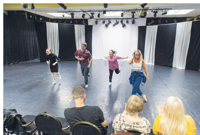
Финалисты «марафона» добегают последние километры