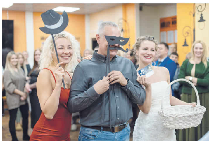
Один из счастливых обладателей подарка по случаю открытия сезона

✓ Новый сезон обещает быть интересным, наполненным незабываемыми встречами с героями новых и уже полюбившихся спектаклей.