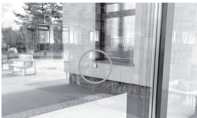
Поврежденное окно Дворца культуры «Дружба»

Несмотря на то что видеонаблюдение на территории дворца ведется и виновные будут установлены и понесут заслуженное наказание, случай неприятный. Тем более, что это не первое покушение вандалов на отремонтиро-