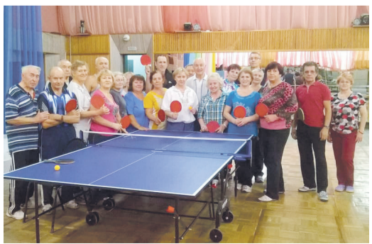
Участники клуба «Первая ракетка»