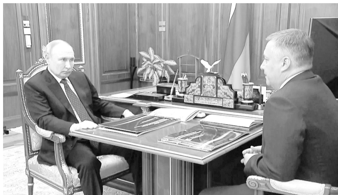
Президент России Владимир Путин и губернатор Иркутской области Игорь Кобзев

17 ИЮЛЯ ПРЕЗИДЕНТ РОССИИ ВЛАДИМИР ПУТИН ПРОВЕЛ РАБОЧУЮ ВСТРЕЧУ С ГУБЕРНАТОРОМ ИРКУТСКОЙ ОБЛАСТИ ИГОРЕМ КОБЗЕВЫМ. ГЛАВА РЕГИОНА ДОЛОЖИЛ О СОЦИАЛЬНО-ЭКОНОМИЧЕСКОМ РАЗВИТИИ, ЗДРАВООХРАНЕНИИ И ПОДДЕРЖКЕ УЧАСТНИКОВ СПЕЦИАЛЬНОЙ ВОЕННОЙ ОПЕРАЦИИ