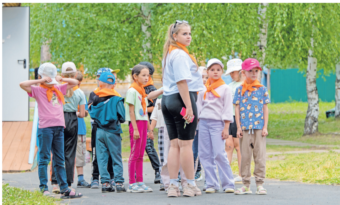
12-й отряд готовится идти на мероприятие

Все время в лагере насыщено событиями, приключениями, интересными меропри-