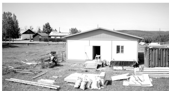
Сооружение ФАПа в Карапчанке в июне 2021 года

– По оборудованию мы добавляем за счёт областного бюджета. Если у нас идёт за счёт модернизации приобретение ФАПов, то всё имущество мы включаем за счёт об-