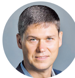
Сергей АЛТУХОВ, депутат Госдумы: