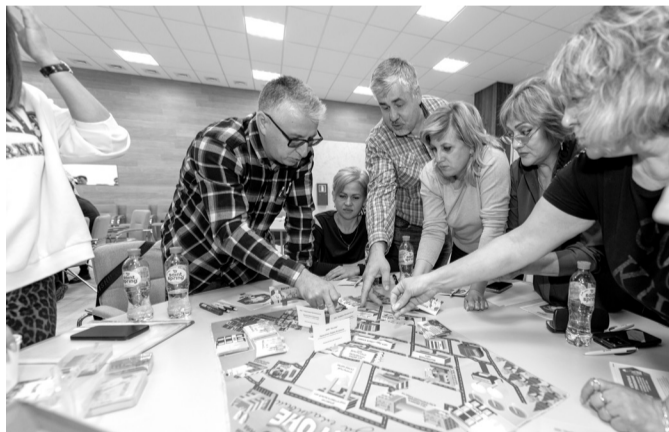
Участники команды «Нулевой травматизм» делают ставки, где находится инженер