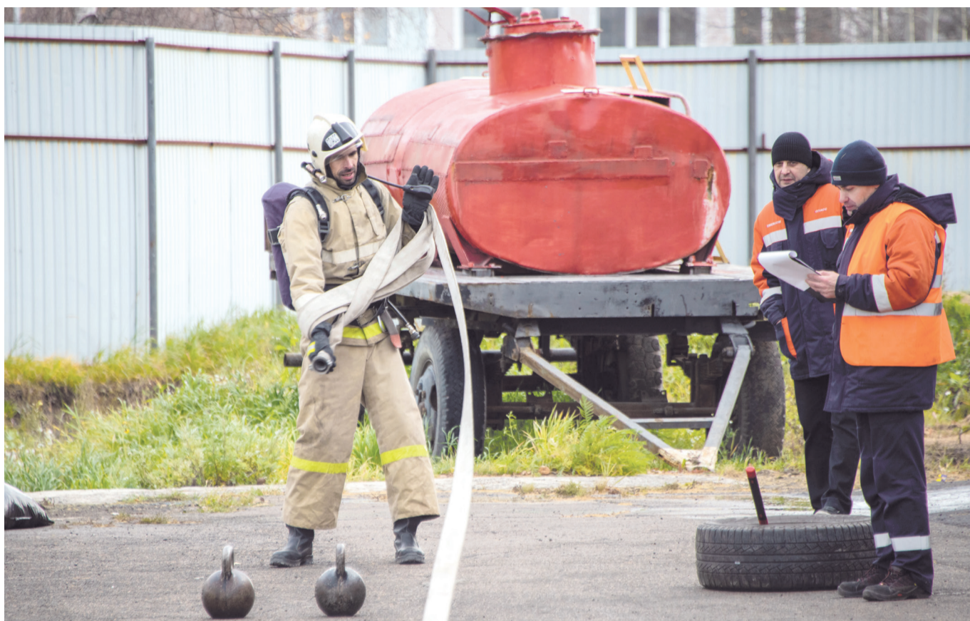
Сматывание проложенной рукавной линии способом «восьмерка»

Постоянный участник кроссфита – командир отде-