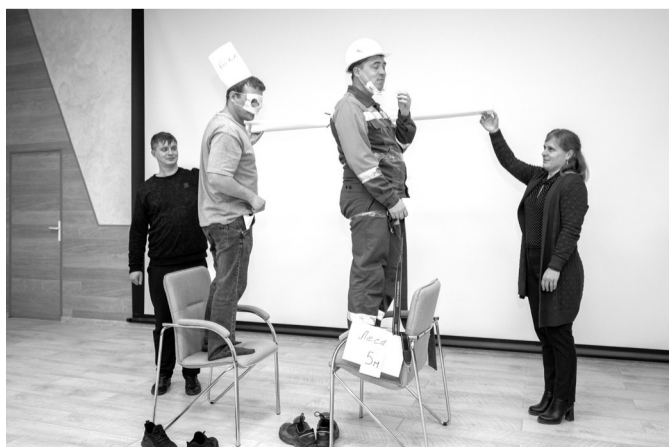
Команда «Энергия» показывает сценку про замену запорной арматуры с лесов на высоте 5 метров