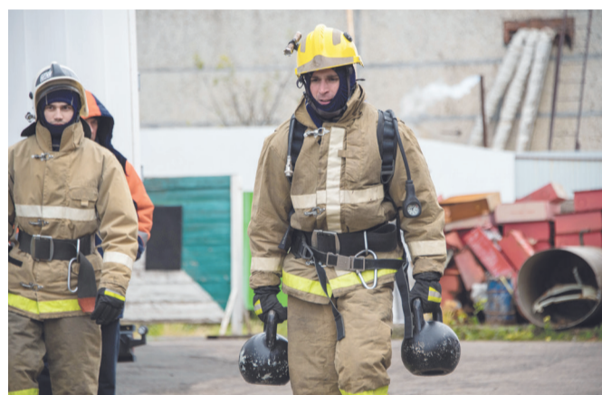
Упражнение «Прогулка фермера»