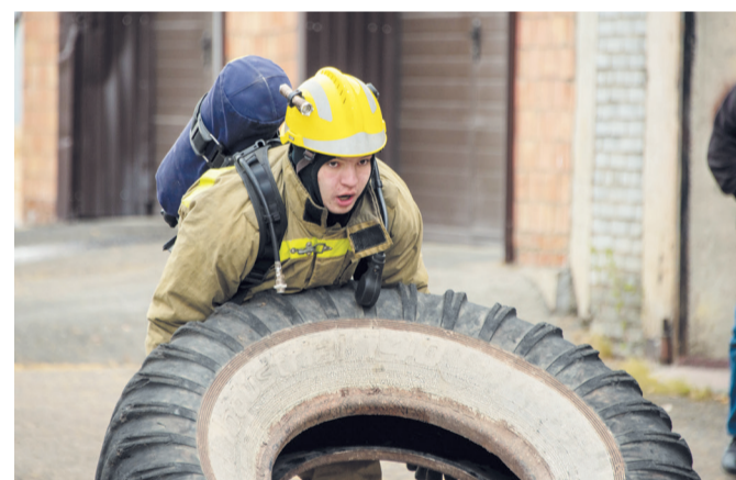
Кантование большой покрышки